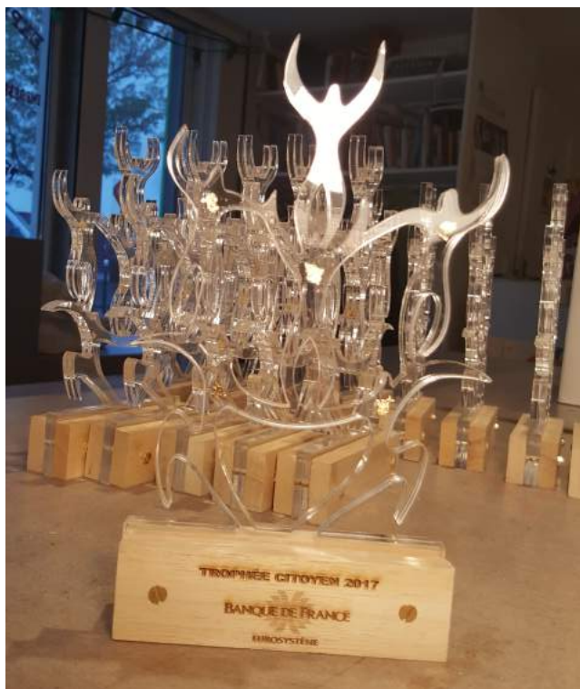
Aperçu du résultat avec le socle en bois gravé.