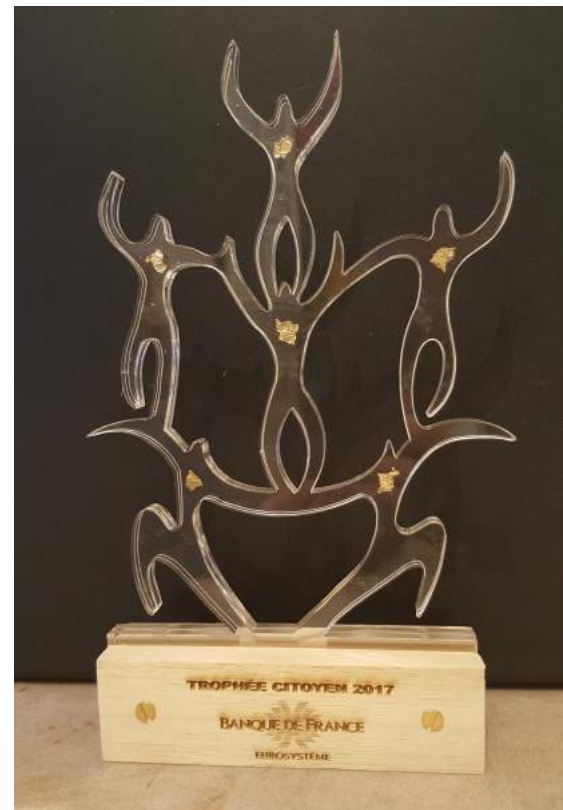
Le résultat du trophée finalisé