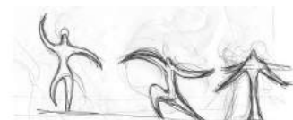
Exemples de modules de base