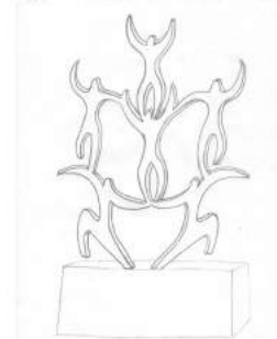
Exemple d'une composition à partir des modules silhouettes

Pour commencer, les artistes sont partis de la notion de « L'engagement citoyen et solidaire ». Pour l'illustrer, ils ont choisi de représenter des personnages qui s'entraident pour « aller plus haut ».