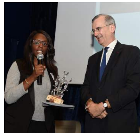
La remise des prix en présence de Monsieur François Villeroy de Galhau Gouverneur de la Banque de France