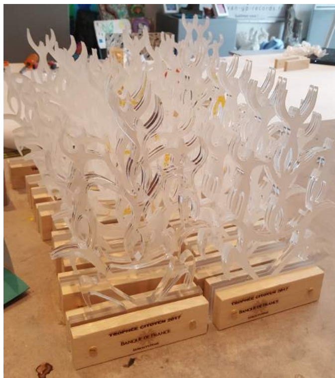
Les 25 trophées après assemblage et fixation des socles